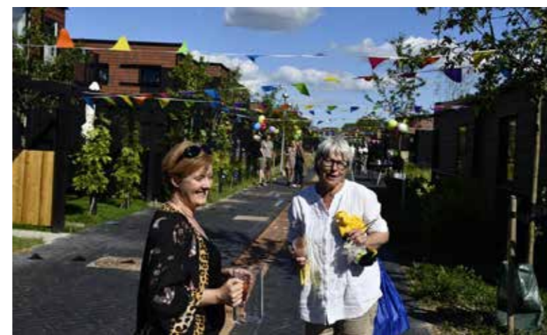
Sommerfest i Solrækkerne.