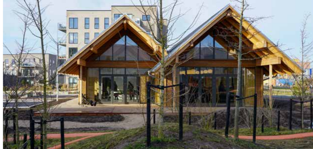
Det første af 3 Kvarterhuse er åbnet. Anvendes af beboerne til fælles aktiviteter.

Ved kvarterpladserne langs Kongelysvej kan man fx tage ophold ved bænke og nyde de blomstrende bede og skyggefulde træer.