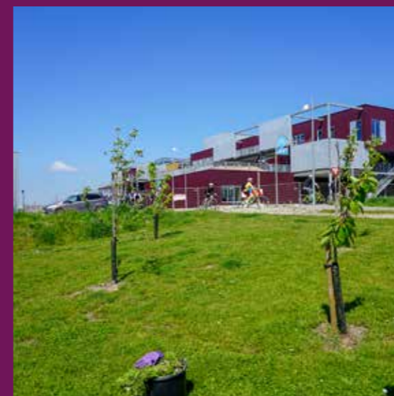
Læringshuset har også uderum på bygningens etager.