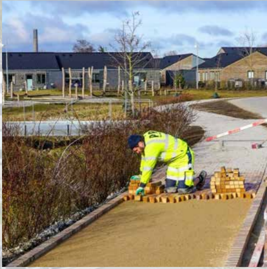
Mange steder i byen findes stier og fortove i klinker - som reference til den tidligere teglværksindustri i området.