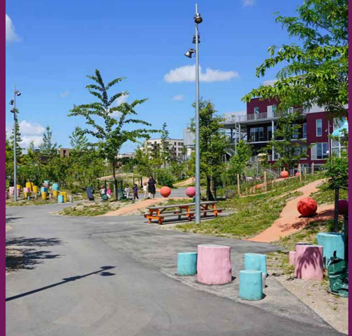
Læringshus og Skolepark ved Loopet i hjertet af Nærheden benyttes af elever og folk i byen.