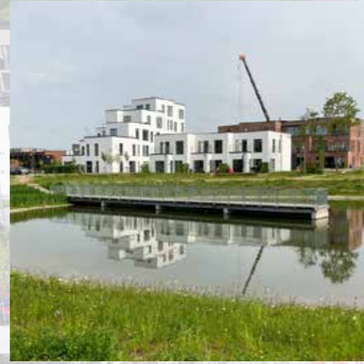
Cirkelsøen er et regnvandsteknisk anlæg, der er udformet til rekreativ anvendelse.