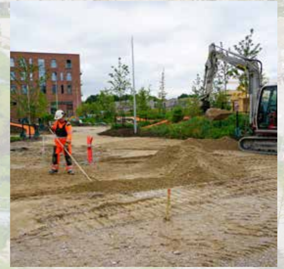
Skoleparken bliver til.