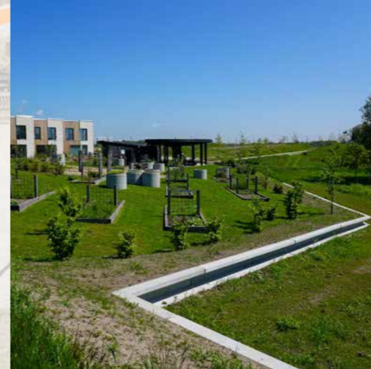
Paddehegnet indrammer beskyttede dyrearter, og giver plads til natur og biodiversitet.