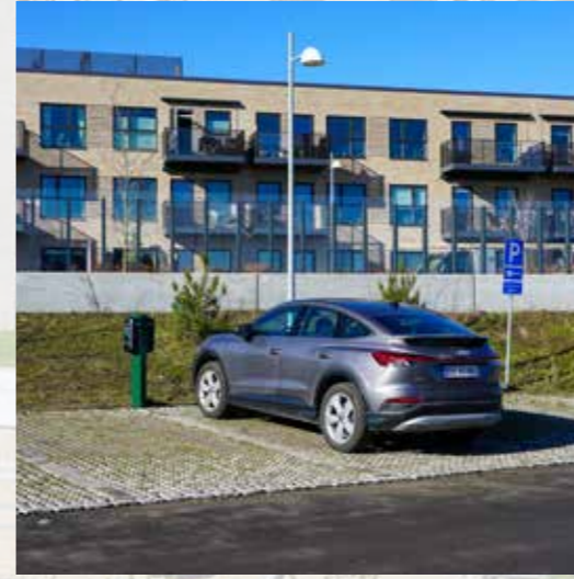
I p-huse og på terrænparkering er der etableret 150 ladepladser, og flere er på vej.