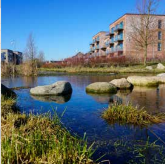
Loopet bidrager til klimasikring i Nærheden.