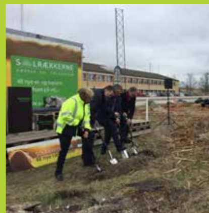
Første spadestik Solrækkerne, 2017.

Samtidig med at selve bydelens kvaliteter på disse måder bliver til virkelighed, bidrager den brede vifte af nye borgere, som Nærheden har kunnet tiltrække, sammen med stærke faciliteter som springcenter, skole og attraktive byrum til projektets ambition om at løfte det samlede Hedehusene.