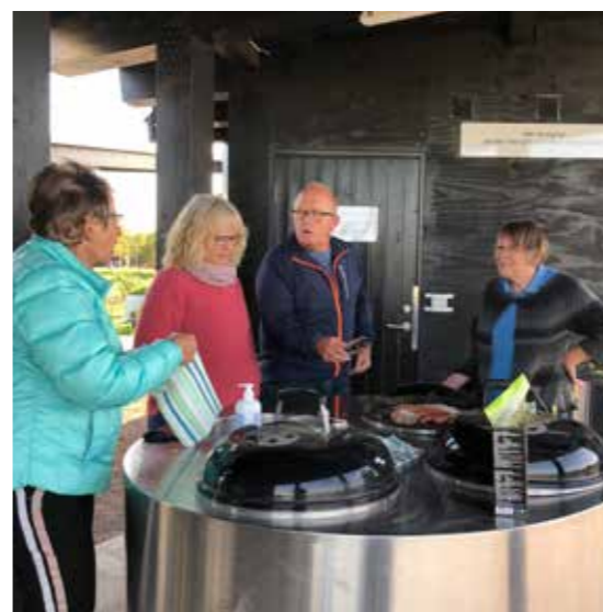
Byhaven byder på gode faciliteter til fælles madlavning, høst fra områdets frugttræer og dyrkning af grøntsager.