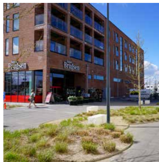
SuperBrugsen åbnede i 2020.