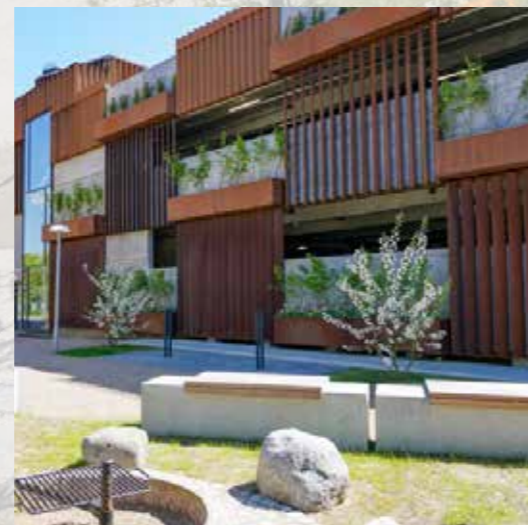
På Sporstræde findes et af de 5 opførte p-huse i Nærheden.