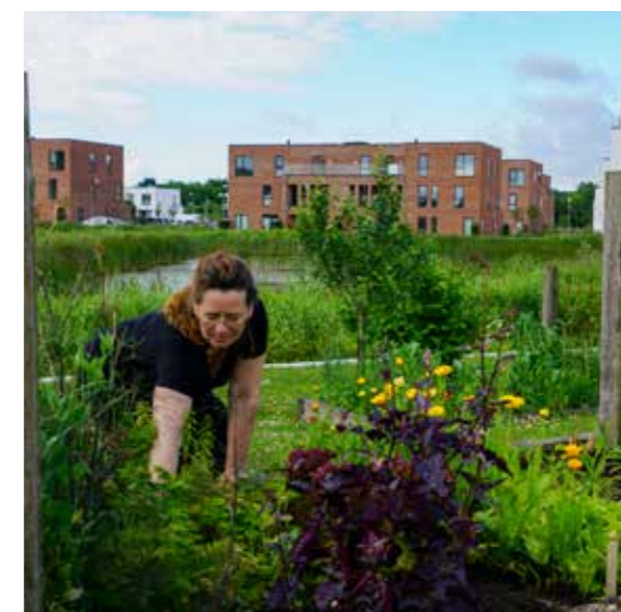
I Byhaven kan man som beboer låne et havelod for en sæson, så man kan så og høste egne grøntsager.