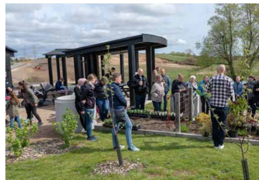
Plantedag i Byhaven

belysning og enkelte friarealer er overdraget til Høje-Taastrup Kommunes drift. De enkelte boligbebyggelser og deres udeområder passes af ejerne og bebyggelsernes grundejerforeninger. De større fællesområder og fællesfaciliteter som blandt andet Loopet, Sejlbjerg Mose, udekøkkenet, kvarterhusene og parkeringshusene er overdraget til drift og vedligeholdelse hos Bydelsforeningen Nærheden, der har alle grundejerforeninger som medlemmer. Bydelsforeningen benytter selskabet Newsec til at varetage foreningens administration og styring af driftsopgaverne.